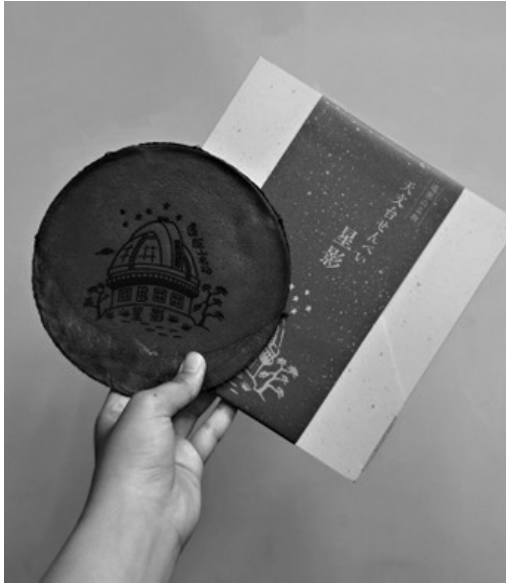
〈天文台せんべい 星影 395円(税込)／1枚〉

当時の焼き印を現在も使用しており、一枚一枚手焼きで焼き印を押した、昔ながらの製法で製造しています。