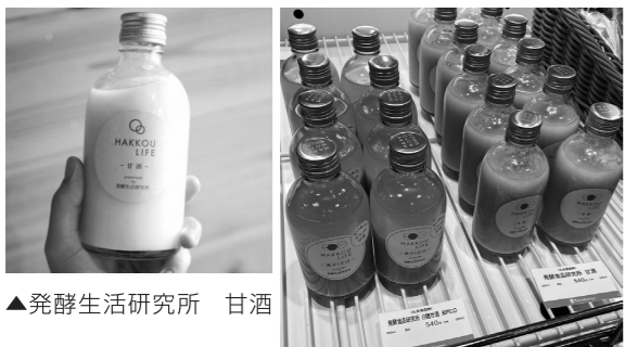
▲発酵生活研究所 甘酒

自社栽培を30年以上行い日本酒を醸してきた丸本酒造が、丹精込めて育てたお米を使用した甘酒