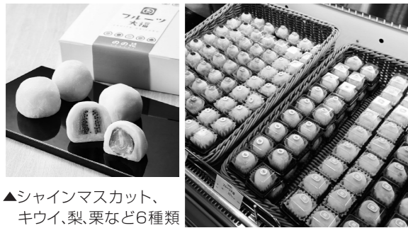
▲シャインマスカット、キウイ、梨、栗など6種類

店主自ら鮮度にこだわって選んだフルーツを、甘さ控えめのこだわり餡で包んだフルーツ大福