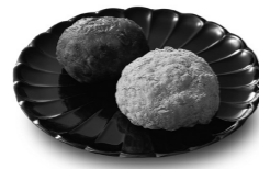
▲ぼた餅 (つぶ餡・きな粉)