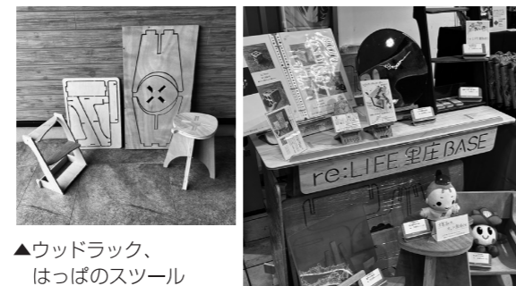
▲ウッドラック、はっぱのスツール

「ものづくりをもっと身近に」をコンセプトに、ものづくりの楽しさを手軽に体験できるキット