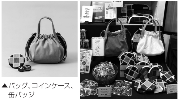
▲バッグ、コインケース、缶バッジ