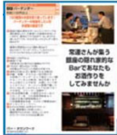
【掲載原稿見本】 1/4 サイズ(117 mm×92mm)で掲載